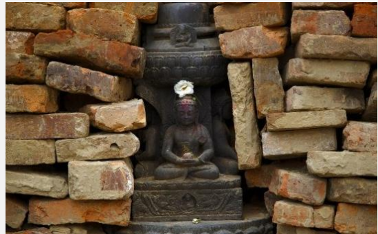
Eine Buddha-Statue zwischen Ziegelsteinen des beim Erdbeben zusammengestürzten Tempels von Bungamati