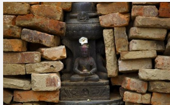
Eine Buddha-Statue zwischen Ziegelsteinen des beim Erdbeben zusammengestürzten Tempels von Bungamati